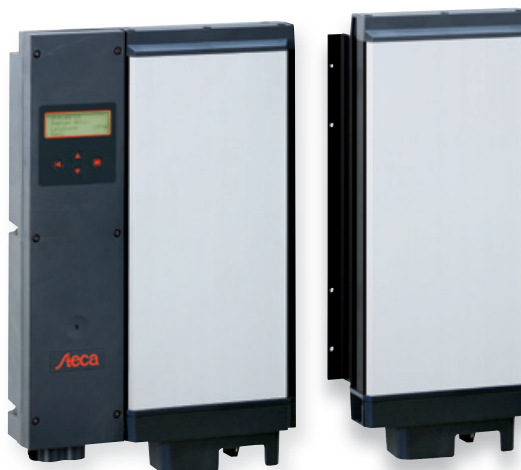
StecaGrid 2010+ Master o. Abb.: StecaGrid 1900 Master, StecaGrid 2000+ Master