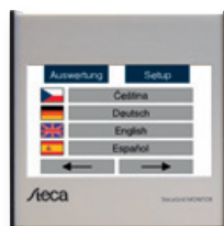
StecaGrid Monitor Datenlogger