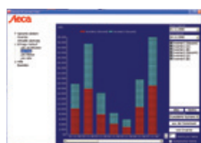
StecaGrid Connect User Benutzersoftware